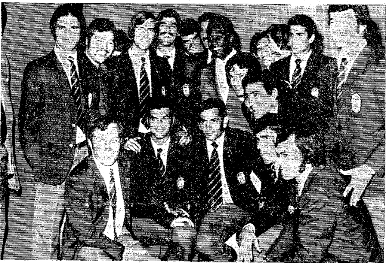
A petición de "DIARIO DE LAS PALMAS", Pelé accedió a fotografiarse con los jugadores de la U. D. Las Palmas.

—Indudablemente que se siente mucha nostalgia. Llevo jugando al fútbol desde los quince años. Es lógico que quiera al fútbol