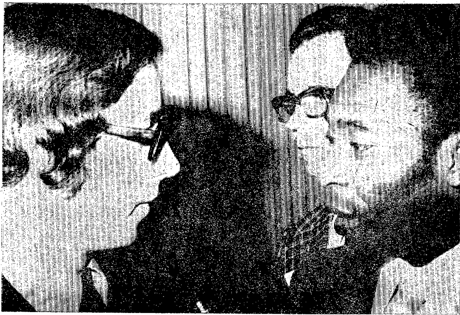
Pelé durante sus declaraciones a Amado Moreno para "DIARIO DE LAS PALMAS"

—Muchas e innumerables pero yo destacaría los tres Campeonatos Mundiales en que logré el título con Brasil y los diversos campeonatos que gané con el Santos. El día